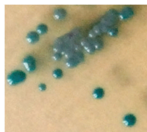
Staphylococcus saprophyticus kolonie turkusowe