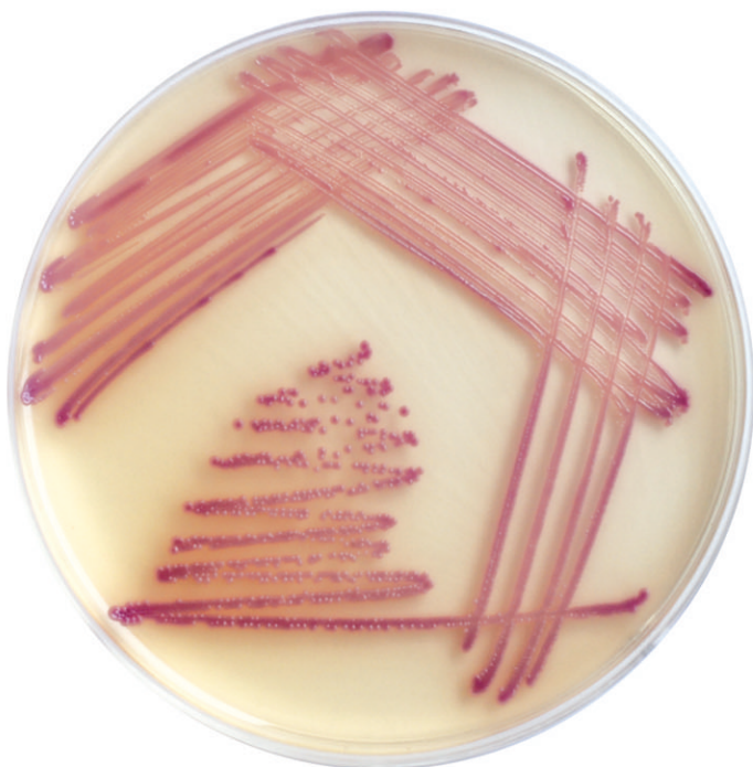
Staphylococcus aureus kolonie różowo - fioletowe